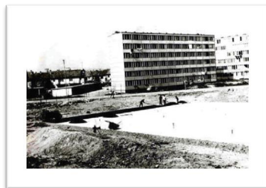
Slika 4. Izgradnja sportskih terena

Već sljedeće školske godine broj učenika popeo se na 986! Svaki razred, osim 7. i 8. imao je čak četiri paralelna odjeljenja! Dvorana za tjelesni odgoj još uvijek nije bila dovršena, pa se nastava održavala na bivšem aerodromu, udaljenom 10-tak minuta