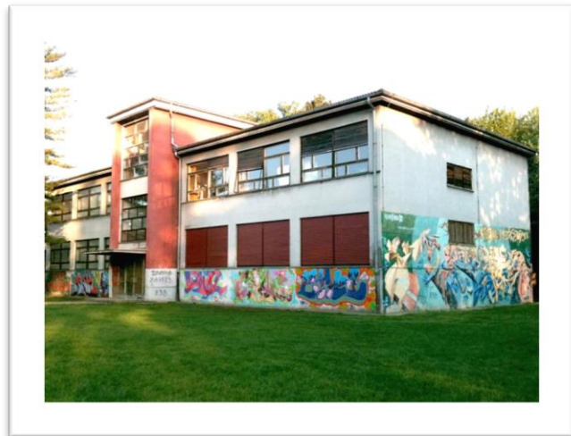
Slika 2. Škola danas