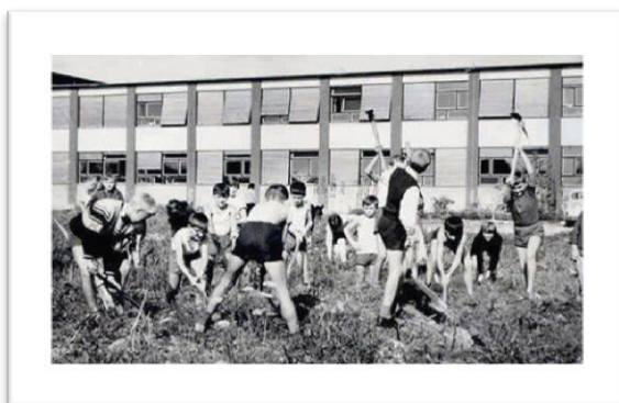
Slika 3. Briga za školski okoliš