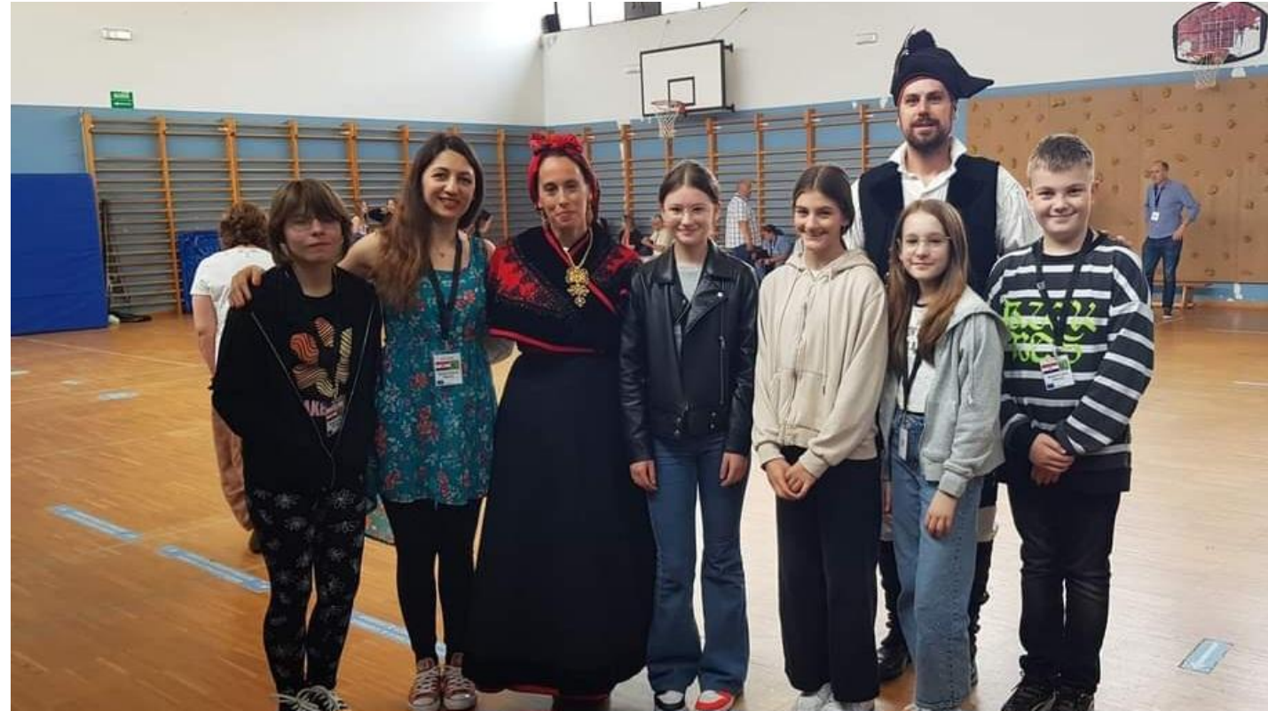
Španjolska, Galicija, svibanj 2023.