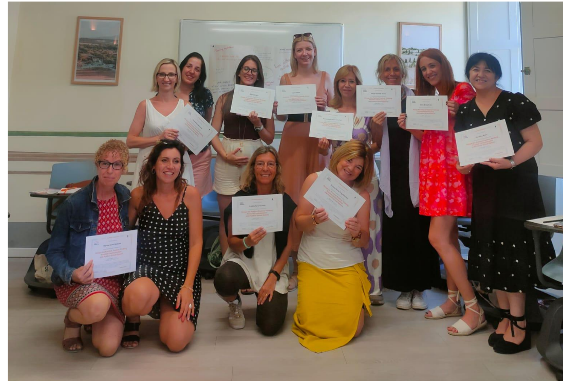
Tečaj Positive Thinking, Positive Communication and Positive School Spaces