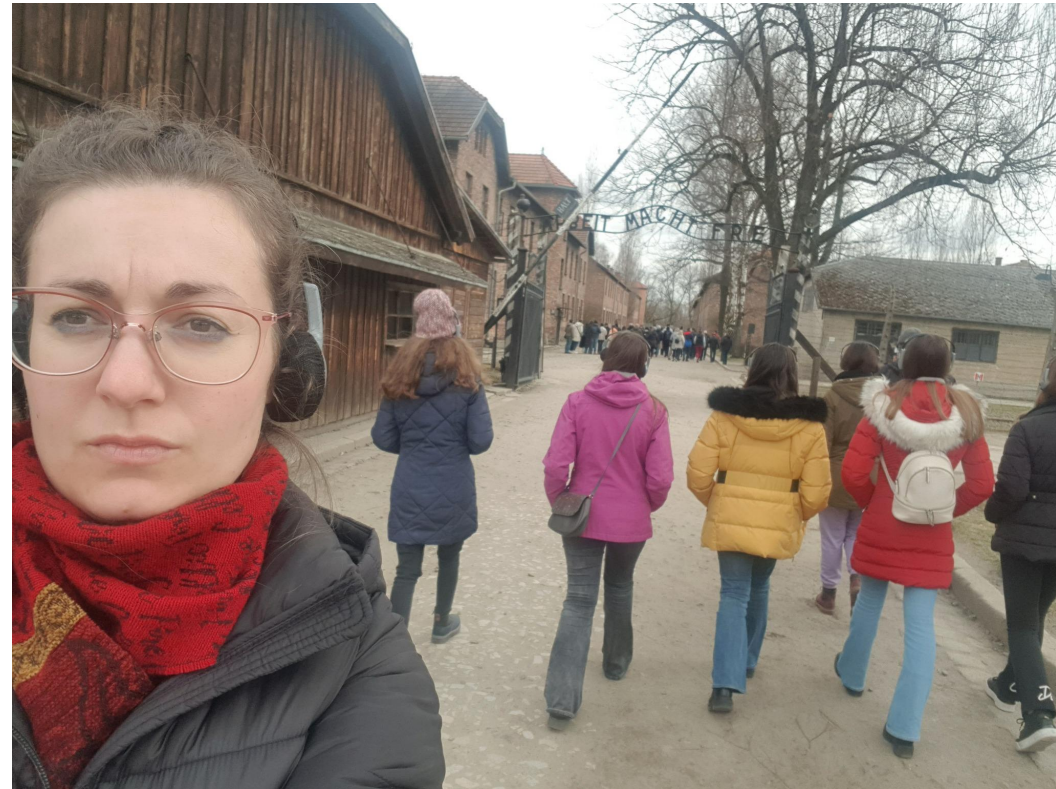
Poljska, Bierun, ožujak 2023.