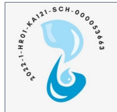
Logo projekta za 2022./2023.